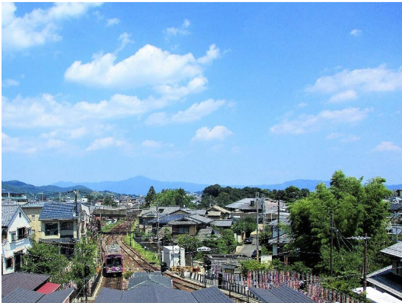
嵐山駅屋上エリア(手前は嵐電嵐山駅とキモノフォレスト、 正面奥は比叡山)