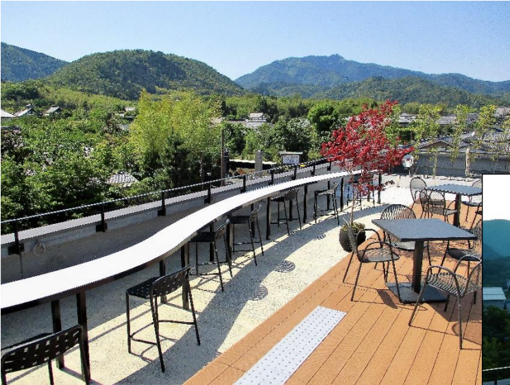
嵐山駅屋上エリア(正面は小倉山、右手は愛宕山)