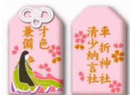
「清少納言社」の「才色兼備お守り」