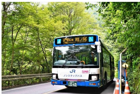
西日本 JR バス