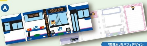
「西日本JRバス」デザイン