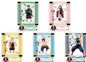
アクリルスタンド (全5種) 各1,320円(税込)

今回のイベントのための描き下ろしイラストを使用したグッズを、映画村・嵐電嵐山駅・嵐電帷子ノ辻駅 映菓座で販売いたします。