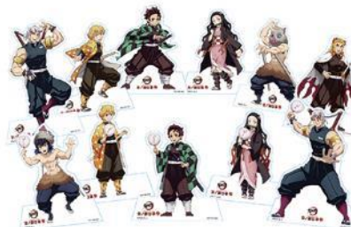
景品：卓上POP (描き下ろし5種、他全11種ランダム配布)

「ガラポン」(1プレイ600円) 出た目の色により、描き下ろしイラストを使用した卓上POPをお渡しいたします。