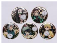
「メタル缶マグネット」