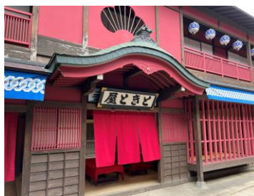
【映画村】 名場面のセット再現