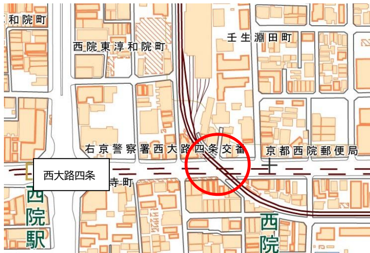
(地図の出典: 国土地理院ウェブサイト)