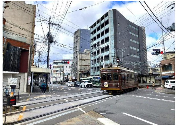
整備箇所 現況 (2024年2月26日撮影)