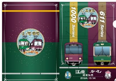
クリアファイル 500円