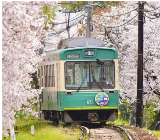
嵐電「江ノ電号」 (モボ631形631号車)

「江ノ電号」2両目の運行スタートに合わせ、現「江ノ電号」、新「江ノ電号」を貸切電車にして、嵐山への小さな旅をお楽しみいただくイベントを開催しますのでお知らせいたします。