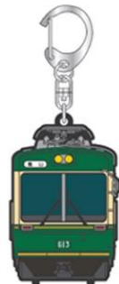
江ノ電号ラバーキー ホルダー800円