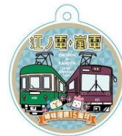
江ノ電号アクリルキーホルダー 全5種 400円