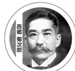
ヘッドマークイメージ