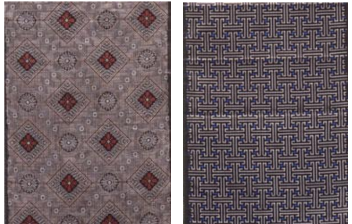
座席シートで使用する「龍郷柄」(左)と「秋名バラ」(右)