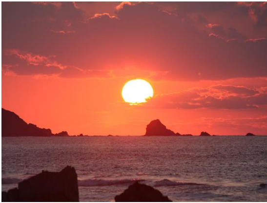
龍郷町嘉渡の夕暮れ

「龍郷柄」は奄美の植物アダンの葉でつくったガジモシヤ(風車)を図案化した細かい連続模様で、娘を嫁がせる時に持たせたと言われていています。秋名の伝統柄「秋名バラ」の「バラ」は琉球語でザルを意味し、全体に黒っぽいザルの格子柄に赤や青の十字字が交差した模様で、全体的に落ち着いた雰囲気ですが、近づくとアクセントの十字が、味わい深い華やかさをかもし出します。