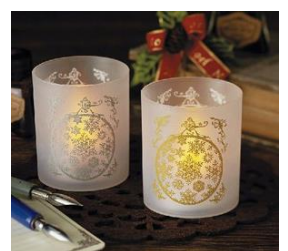
【プレゼントイメージ】