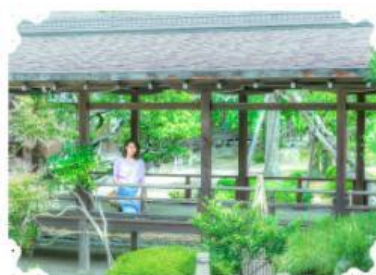
【しっとり過ごす大人の休日】