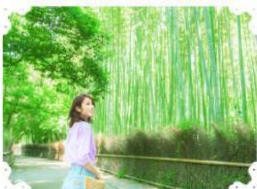
【パワスポで恋愛祈願】