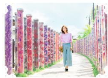
【感性を磨くアート&カルチャー】