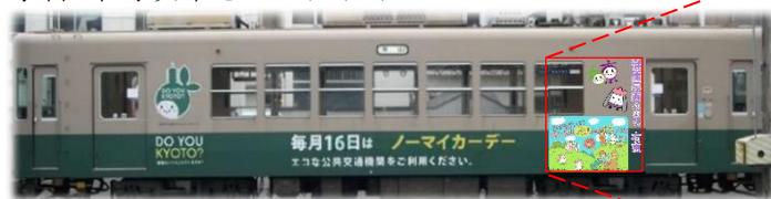
車両ラッピングのイメージ