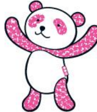
大丸松坂屋公式キャラクター 「さくらパンダ」