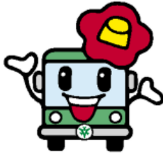
市バスイメージキャラクター 「京ちゃん」