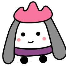
嵐電イメージキャラクター 「あらんちゃん」