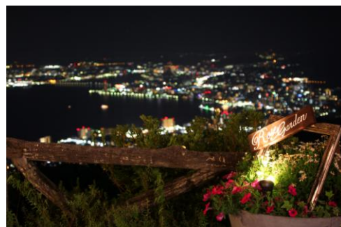
園内より大津市内・びわ湖を望む

※恋人の聖地とは、2006 年 4 月 1 日より、全国の観光地域の中からプロポーズにふさわしいロマンティックなスポットとして現在、全国で約 100 ケ所認定されています。